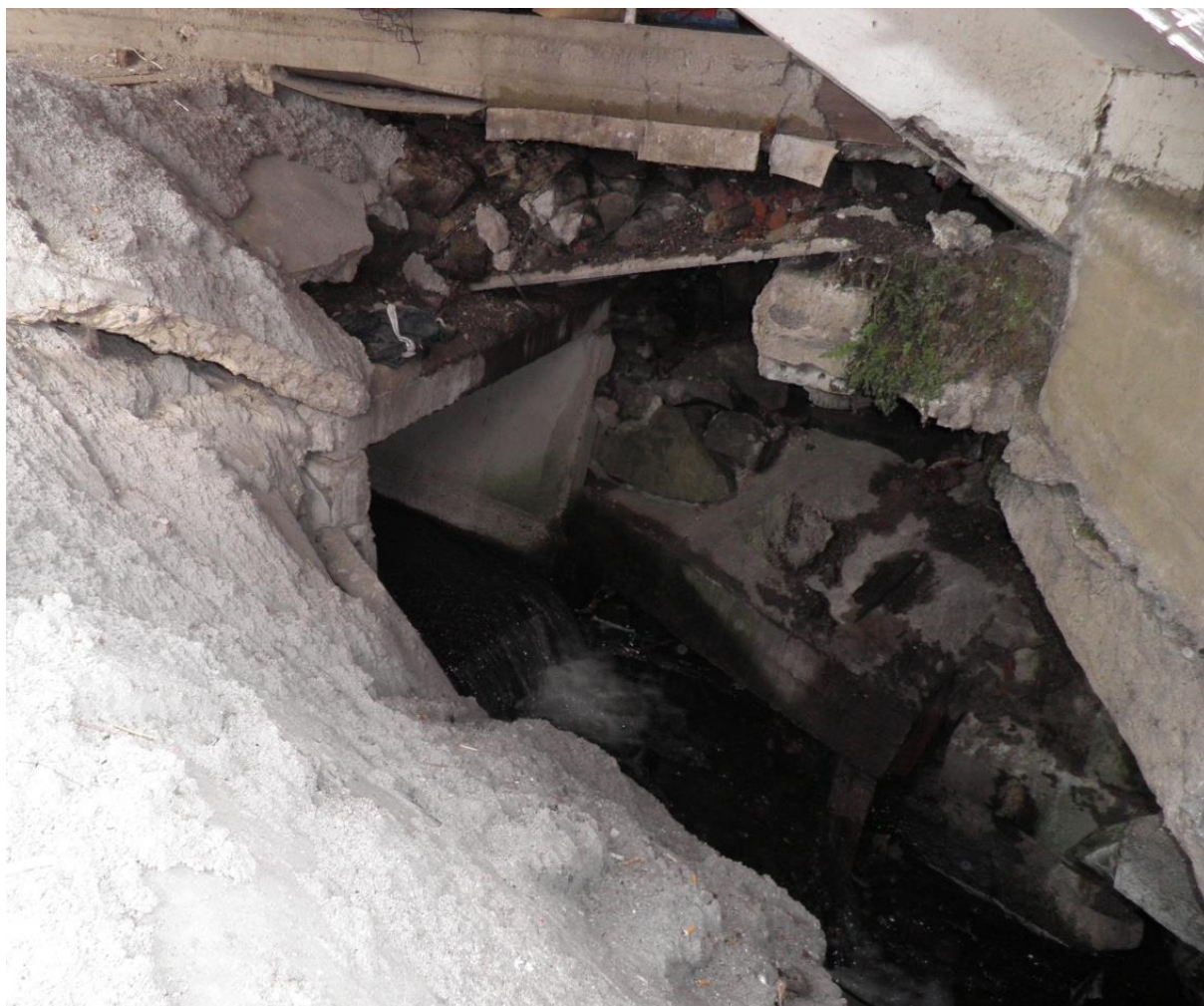
Obrázek 4: Foto ohroženého místa (TURYSKY_P_0014)

Ohrožení říčními povodněmi – neprofesionálně provedené zatrubnění pod restaurací a nákupním střediskem v dolní části obce – nekapacitní, vede k zaplavování domů.