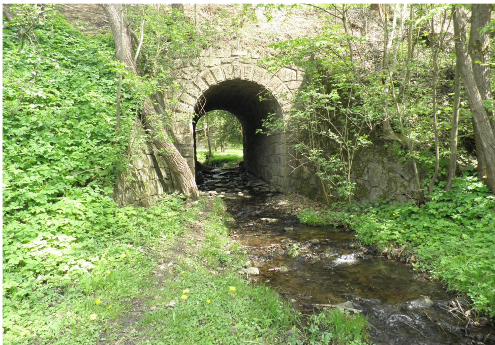
Koncentrace soustředěného odtoku do pf železničního mostu

Soustředěný odtok z lesnatého povodí v kombinaci s průtokem v Turyňském potoce z horní části povodí - vše koncentrováno do pf železničního mostu.