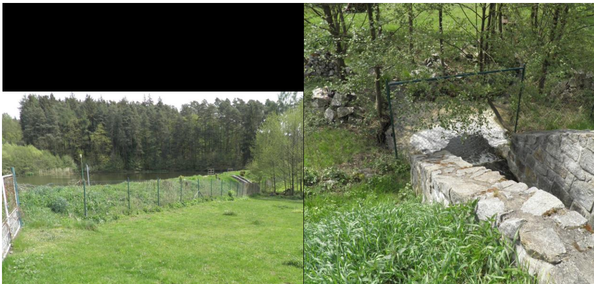
Obrázek 2: Foto ohroženého místa – rybník Losy (TURYSKY_P_0012)

Rybník Losy – při větších povodních přeteče, na odtoku od bezpečnostního přepadu koryto potoka přehrazeno plotem. Dochází k zaplavení chat a zahrádek.