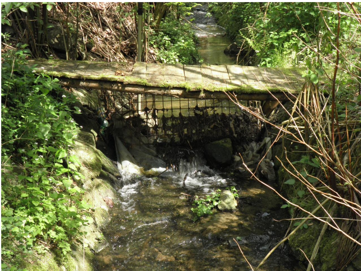
Obrázek 3: Foto ohroženého místa (TURYSKY_P_0013)

Potenciální ohrožení říčními povodněmi v důsledku omezení průtočné kapacity toku – ploty, provizorní stavby, atd.