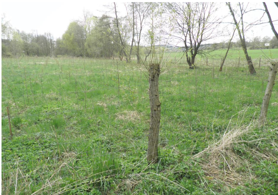
Soutok Brejlovského potoka s bezejmenným potokem na horním okraji Netvořic

Na horním okraji obce se nachází soutok dvou potoků s přibližně stejně rozsáhlým povodím - souběh odtoků z obou povodí způsobuje vybřežování Brejlovského potoka v obci Netvořice a záplavy každé 2 až 4 roky. Horní část povodí pokrývají převážně pole.