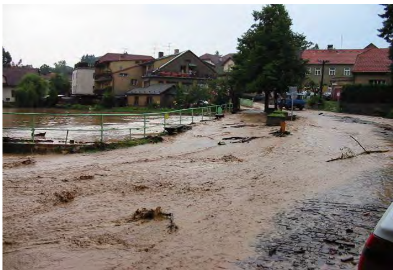
Vybřežení toku na náves a přes návesní rybník v roce 2002.

V obci je nejproblematictější tokem Oborský potok, který je pravostranným přítokem Sázavy. Horní část povodí pokrývají pole. Střední a dolní část je lesnatá. Ve střední části toku cca 1 km nad obcí jsou vrty, ze kterých je čerpána voda do obecního vodovodu. Problematickým úsekem je poslední část toku před ústím do Sázavy. Tok je při průchodu obcí z větší části zatrubněn a kapacita zatrubnění je nedostatečná a rozlivu do obce dochází často.